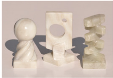
石彫 男子部高校1年、中等後期4年