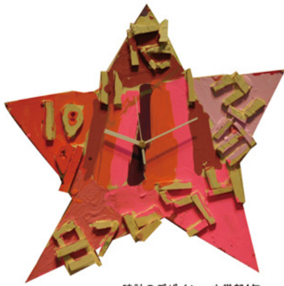
時計のデザイン 小学部4年