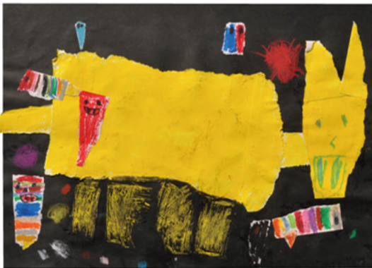
「ふしぎないきもの」小学部2年