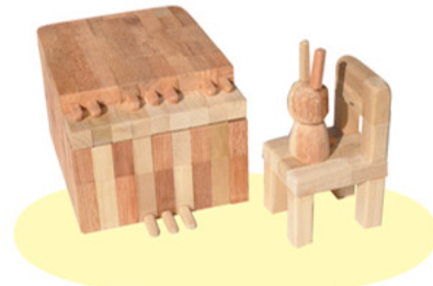
寄木細工「ウサギのピアニスト」女子部中学1年