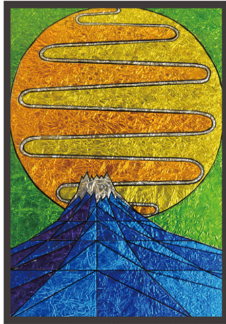
ステンドグラス 男子部中学3年