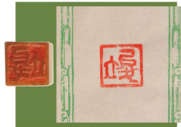
篆刻「竣」中等前期3年