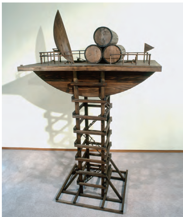
《夢のような気がするね》1988年