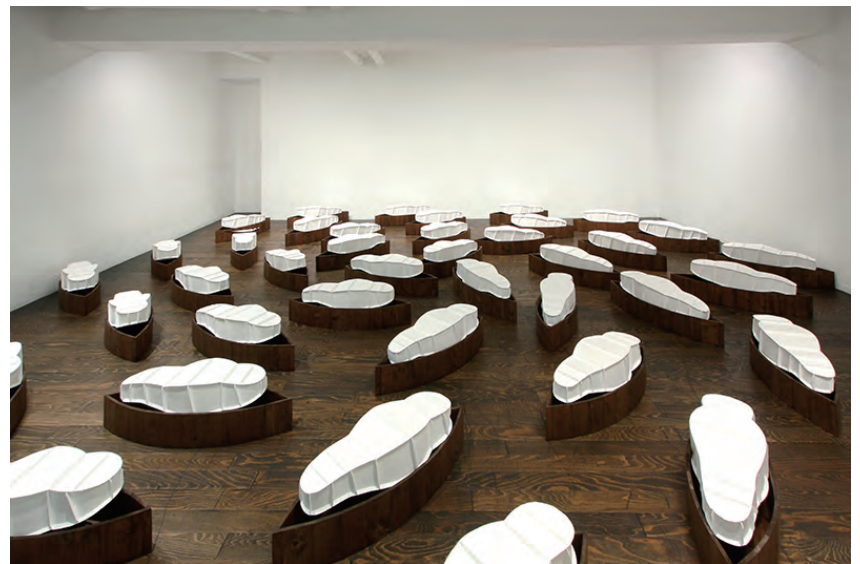
《世界のはじまり 世界の終わり》2008年